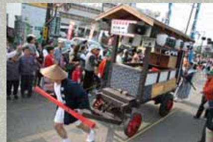
中仙道武州蕨宿宿場まつり