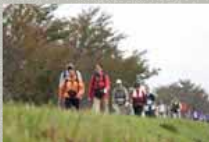
日本スリーデーマーチ