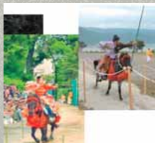
出雲伊波比神社古式流鏝馬祭